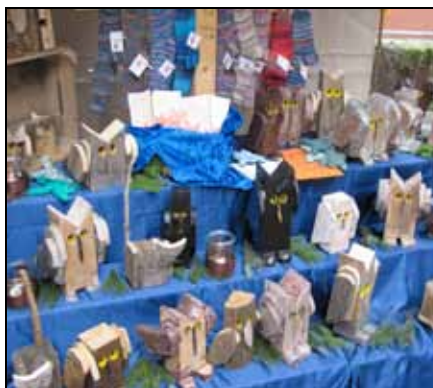
Holzschnitzarbeiten der LVR-Förderschule

Doch auch auf Seiten der Aussteller erfüllte sich der eine oder andere Wunsch. Beispielhaft sei an dieser Stelle die 10. Klasse der LVR-Förderschule Oberhausen erwähnt. Die schwer- und schwerstbehinderten Kinder und Jugendlichen arbeiten seit 3 Jahren unter Anleitung ihrer Fachlehrer daran, Holzschnitzfiguren herzustellen